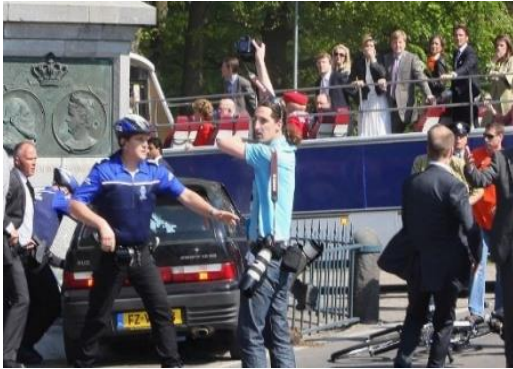
Koninginnedag 2009